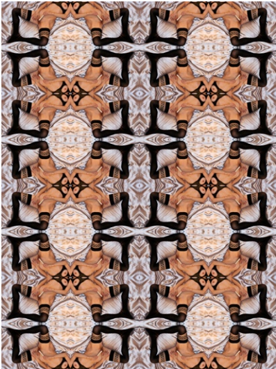
'Sex-mirror #35' ( fantasma latex )

La Galeria Lina Davidov presenta en ART-MADRID las dos últimas series fotográficas de Carmen Arrabal: 'Sex-mirrors' y 'Emotions'.